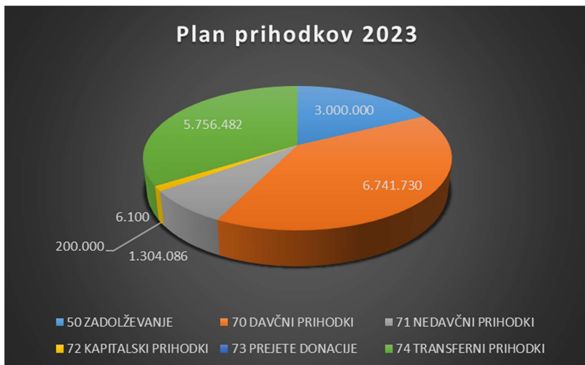
Slika 10: Plan prihodkov za leto 2023