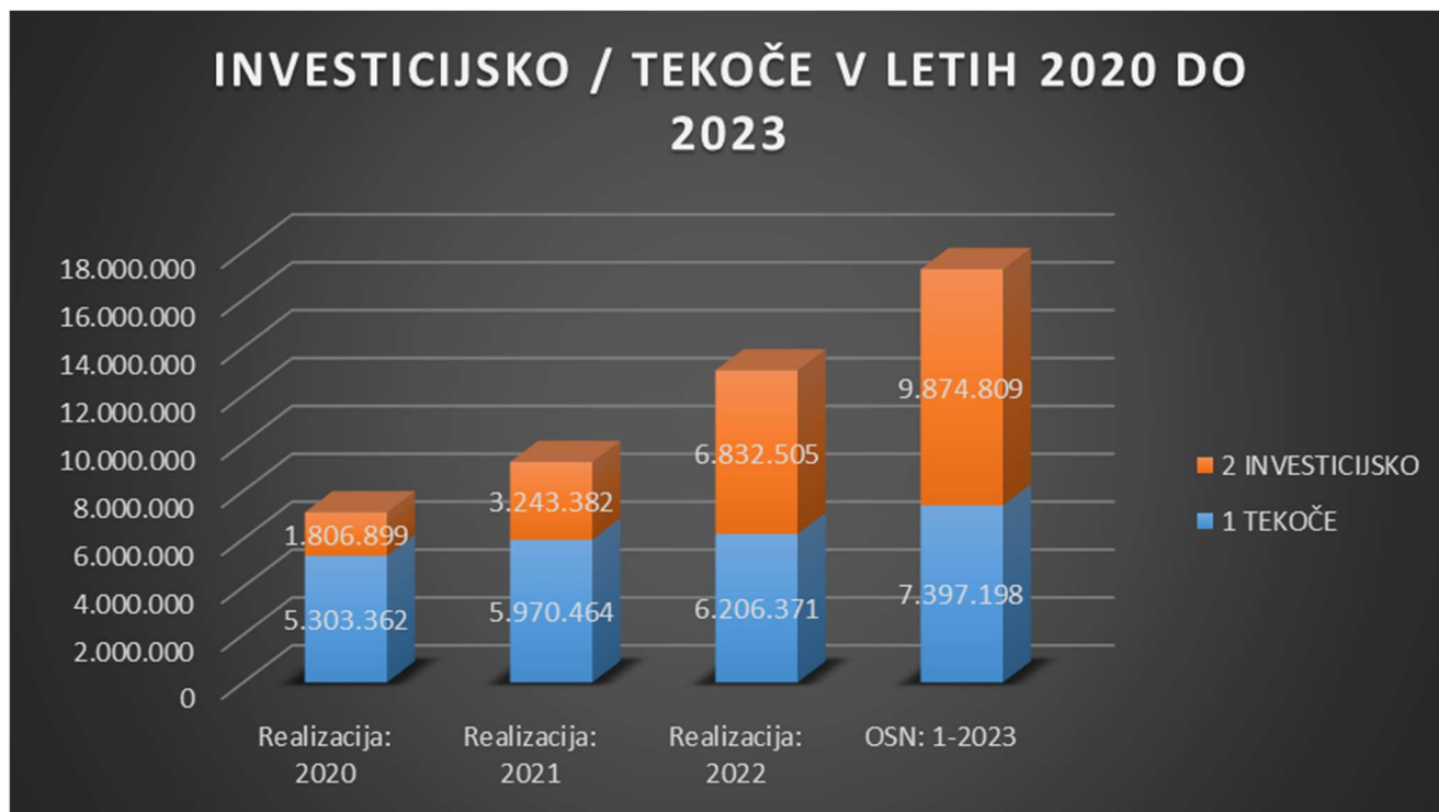
Slika 8: Primerjava med leti 2020 do 2023