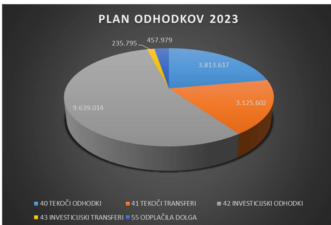
Slika 9: Plan odhodkov za leto 2023